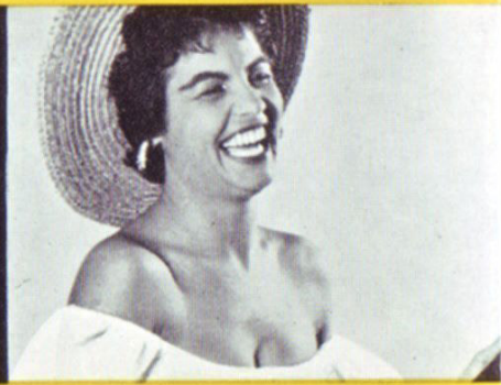
Für Weitwinkel: Mit Redufocus (Brennweite 6,5 mm)